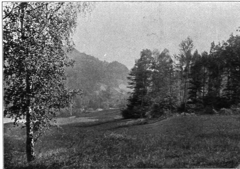
Fig. 397 Partie von der Insel Wörth (S. 378)

Die Insel Wörth gehört zur Hälfte zu Ober-Österreich; der Sage nach soll sie früher mit dem niederösterreichischen Ufer zusammengehangen sein und erst im XVIII. Jh. durch Entstehung des Hößganges, des toten Armes, der sie südlich umfängt, zur Insel geworden sein. Seit dem Ende des XVIII. Jhs. ist