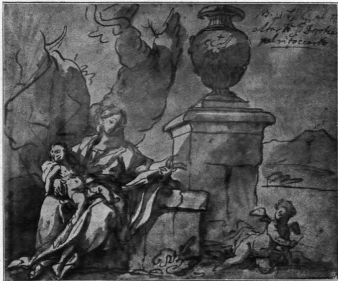
Fig. 357 Melk, Stift, Bibliothek, Skizzenbuch des M. Altomonte, f. 77 (S. 344)