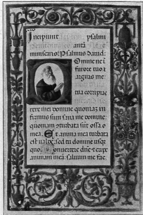
Fig. 347 f. 58