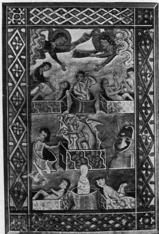
Fig. 344 Melk, Stift, Bibliothek, Handschrift 1833, Auferstehung der Toten (S. 335)

f. 2. Initial C. Blau mit monochromen Innenranken, auf Gold; in violetter eingeschlossenen Felde Halbfigur des segnenden Christus mit Buch. Stilisierte Pflanzenranke als Randleiste; in der Mitte unten Wappen wie in f. 1' an derselben Stelle.