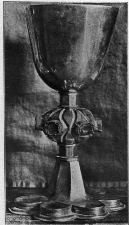
Fig. 321 Kelch (S. 321)