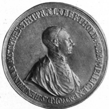
Fig. 315 Melk, Stift, Medaille auf Abt Berthold Dietmayr (S. 308)

Vermerckht was die verordenten dem Gottshaus Molckh von khlainoten in die Sacristey und Trinckhgeschier wider geben haben.