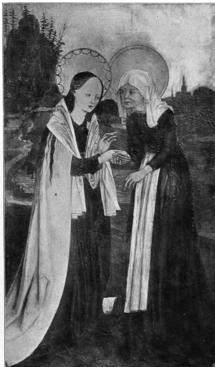
Melk, Stift Fig. 309 Heimsuchung (S. 303)

und XVII. Jh. Ferner in einem Holzkästchen des XVII. Jhs. Schlüsselsammlung und Petschaft, zumeist aus dem XVIII. Jh. stammend.