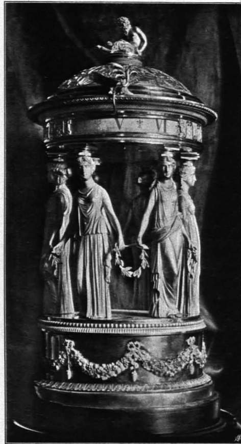
Fig. 292 Melk, Stift Standuhr von Joh. Forck (S. 292)

farbenen Putten gehaltenes bronzefarbenes Medaillon mit einer Szene aus dem Leben des hl. Benedikt. Das Deckengemälde stellt ein mächtiges steinfarbenes, architektonisches Gerüste mit tragenden Vertikal-konsolen und schmückenden Blumenvasen in Nischen dar, das einen mittleren bronzefarben gerahmten Durchblick frei läßt. Darinnen allegorisches Gemälde, den Triumph des hl. Benedikt auf einem von Repräsentanten aller Rassen geleiteten Wagen, über dem vorn die Fama mit der Tuba, hinten der bärtige Chronos mit der Hippe fliegt und in der Mitte die hl. Dreifaltigkeit thront. Rechts unten sitzt ein Papst und deutet auf einen Block mit der Aufschrift: Honori magni Patriarchae Benedicti . 1719 von Hippolyto Sconzani gemalt. S. 199 (Fig. 293).