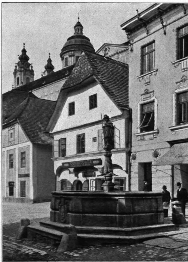
Fig. 207 Melk, Kolomannibrunnen (S. 170)