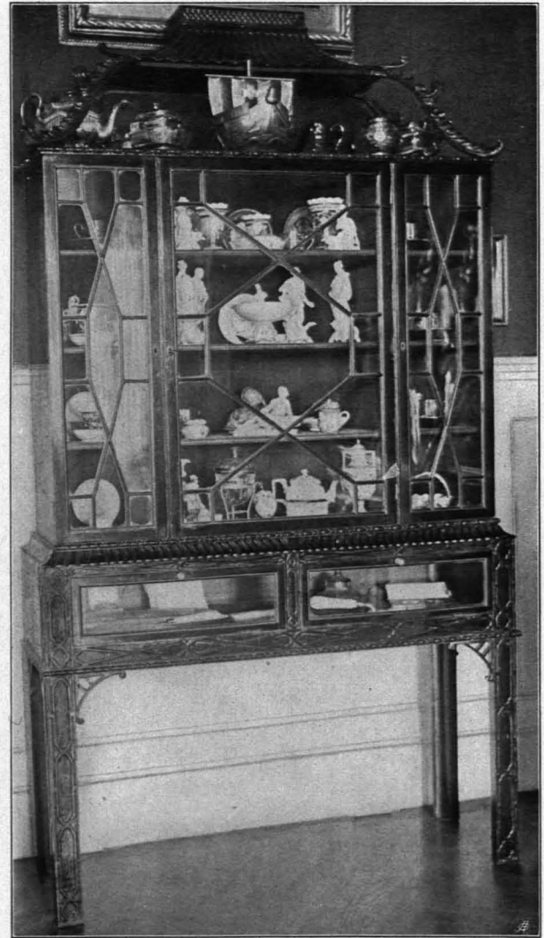
Fig. 99 Sooß, Chippendale-Kasten (S. 80)

Kommode, Mahagoni mit vergoldeten Beschlägen, in der Mitte ovales Medaillon, gesticktes Bild eines Reiters auf rosa Seide appliziert. Um 1800. Aus dem Besitze der Fürstin Arenberg stammend.