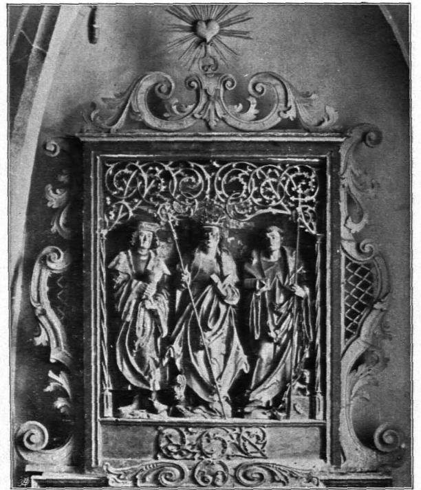
Fig. 67 Ochsenbach, Schreinaltärchen (S. 53)

Altäre: 1. Hochaltar; Holz, schwarz und vergoldet. Rundbogig geschlossener, von Säulen flankierter Bildaufbau