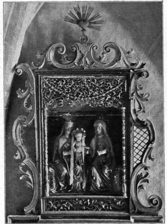
Fig. 68 Ochsenbach, Schreinaltärchen (S. 53)