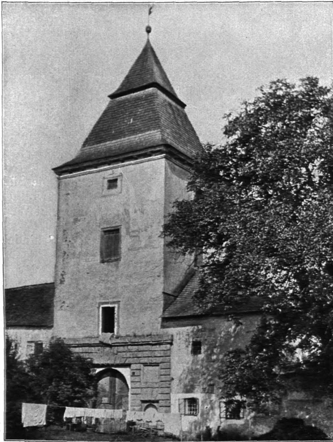
Fig. 62 Freydegg, Schloß (S. 49)

Beschreibung: Das Streunsche Schloß, das mit seinen Nebengebäuden ein mächtiges Gartenrechteck umschloß, heute bis auf wenige Reste verfallen (Fig. 62).