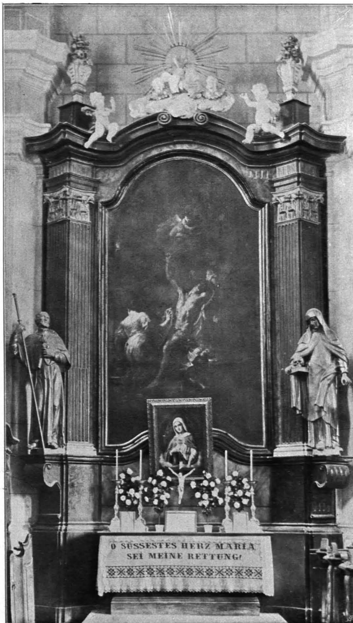
Fig. 412 Pöchlarn, Seitenaltar (S. 392)

Kaseln: 1. Roter Samt, Mittelstreifen silbergestickt, großes Ornament. Ende des XVIII. Jhs.