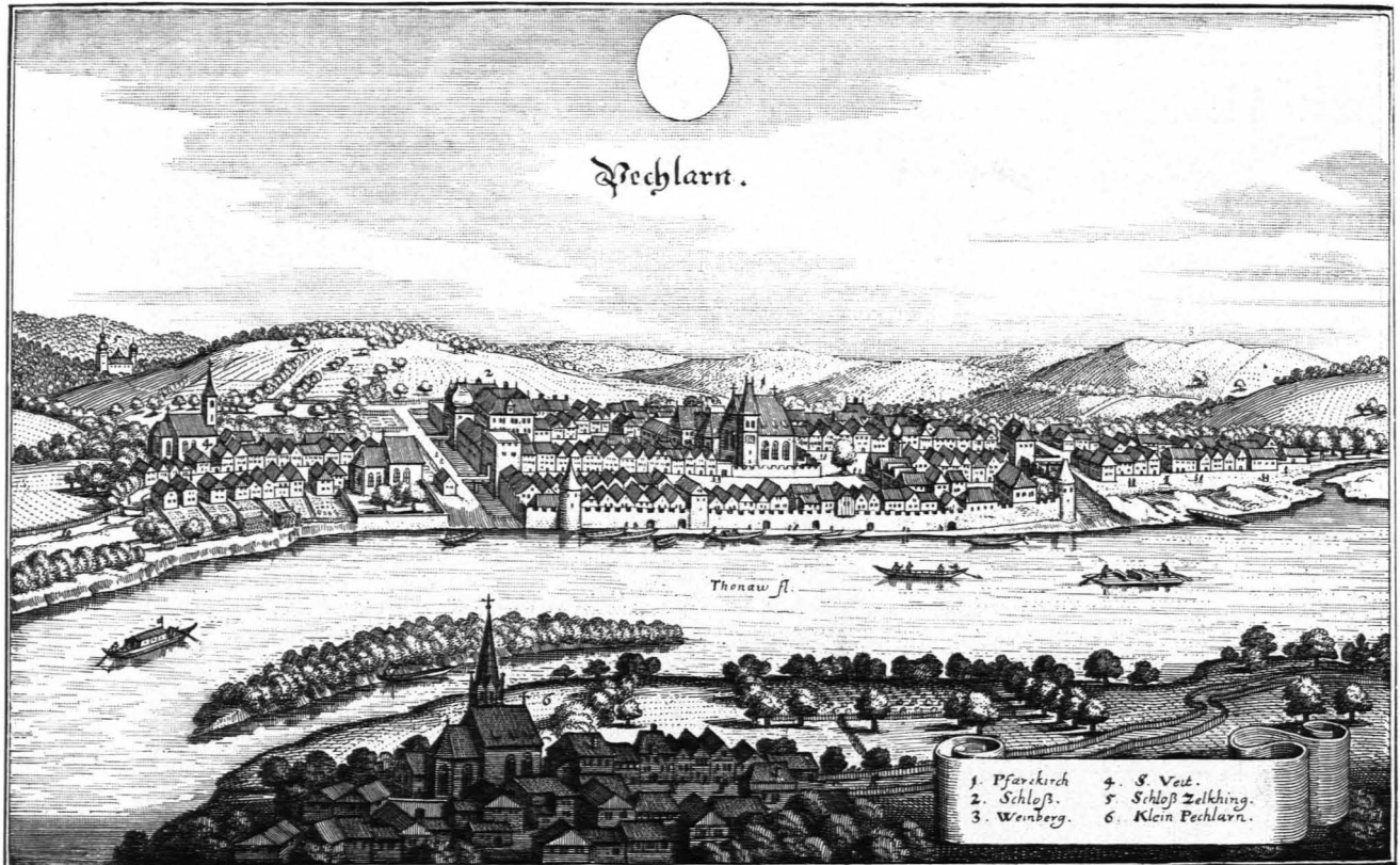
Fig. 411 Ansicht von Pöchlarn nach dem Merianschen Stich von 1677 (S. 390)