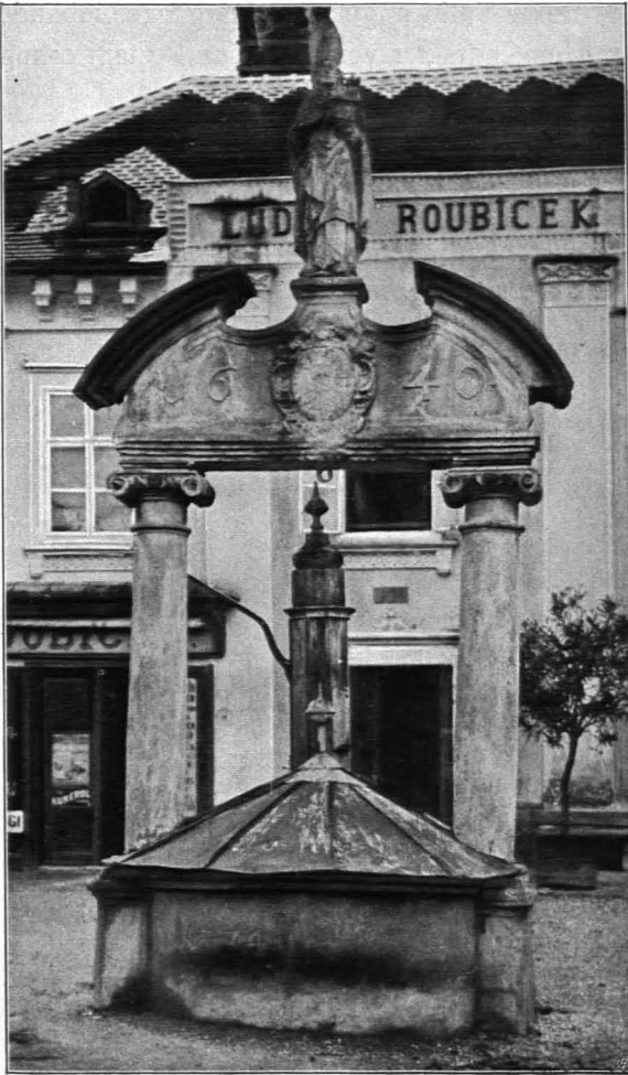
Fig. 416 Pöchlarn, Brunnen (S. 397)

quadratisches abgestuftes Gebälk, das die affrontierten Gruppen der hl. Dreifaltigkeit — Gott-Vater mit dem Kreuzifixus zwischen den Knien — und Pietà — Madonna mit dem Leichname Christi im Schoße — trägt. Zweite Hälfte des XVII. Jhs. (Fig. 415). Dem Schwabeggkreuz bei St. Gotthard verwandt (s. Fig. 87).