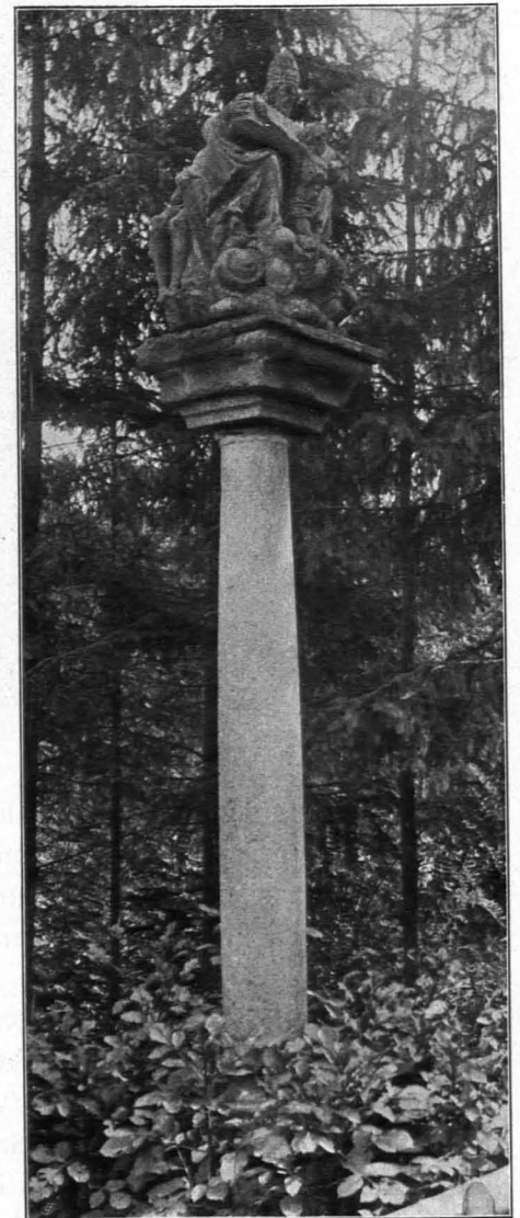
Fig. 415 Pöchlarn, Bildstock (S. 397)

Bildstöcke. Bildstöcke: 1. Am Ostende an einer Straßenkreuzung; grauer Sandstein. Auf prismatischem Sockel hohe runde Säule, darauf