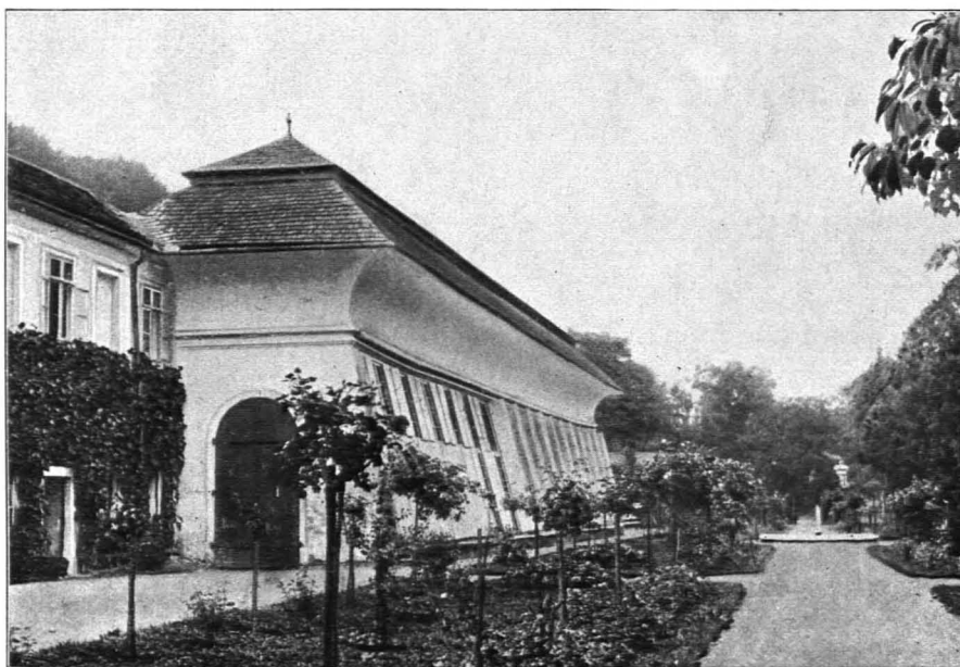
Fig. 388 Melk, Stift, Palmenhaus (S. 370)

Kolomanni- statue. Kolomannistatue: Auf einem Felsen des steilen Nordabhanges des Stiftshügels Sandsteinstatue des hl. Kolomann. Erste Hälfte des XVIII. Jhs.