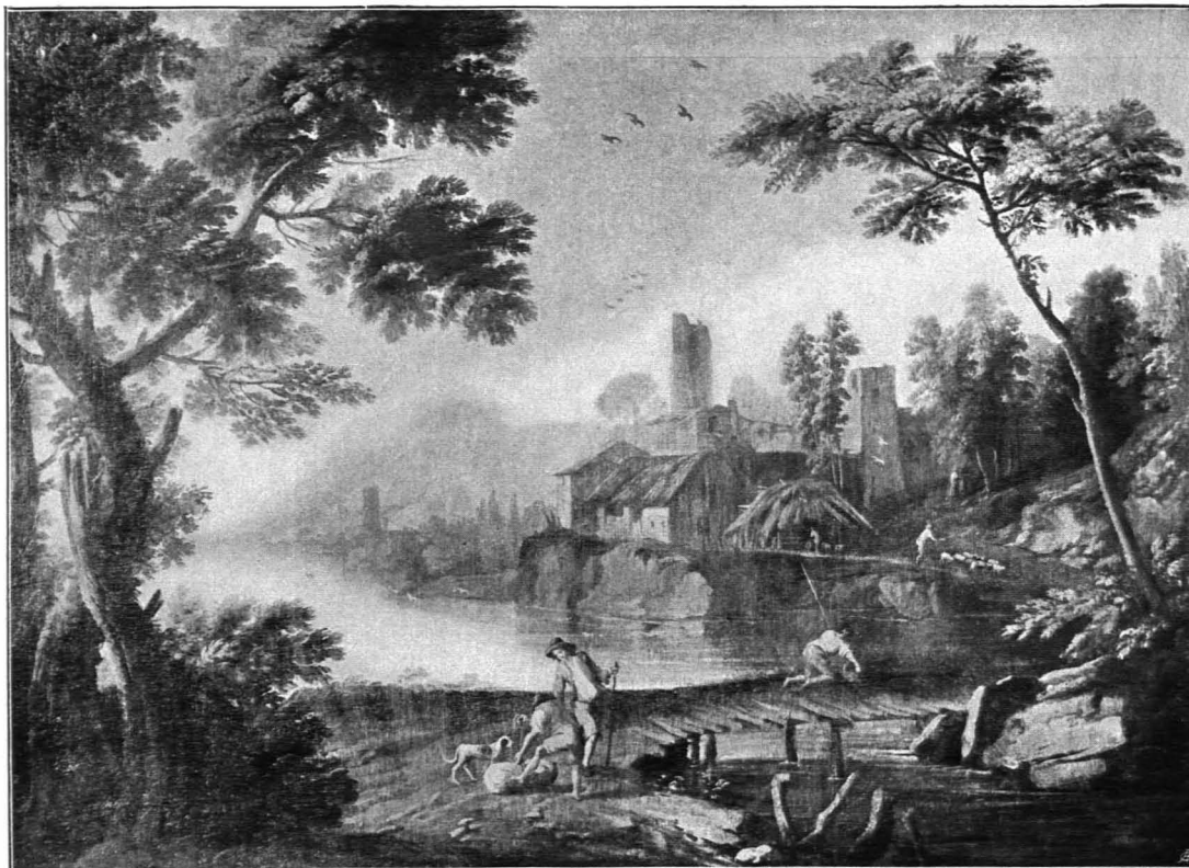
Fig. 390 Kimmelbach, Schloß, Landschaft von Huchtenberg (S. 371)

Allg. Charakt. An der Reichsstraße Wien—Linz eben und reizlos gelegen. Großer Ort mit einigen stattlichen Höfen und einer platzartigen Straßenerweiterung mit dem Durchblick auf die Kirche. Infolge der zahlreichen Brände fast durchwegs modernen Charakters.