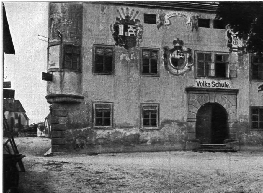
Fig. 394 Neumarkt, Schule (S. 376)