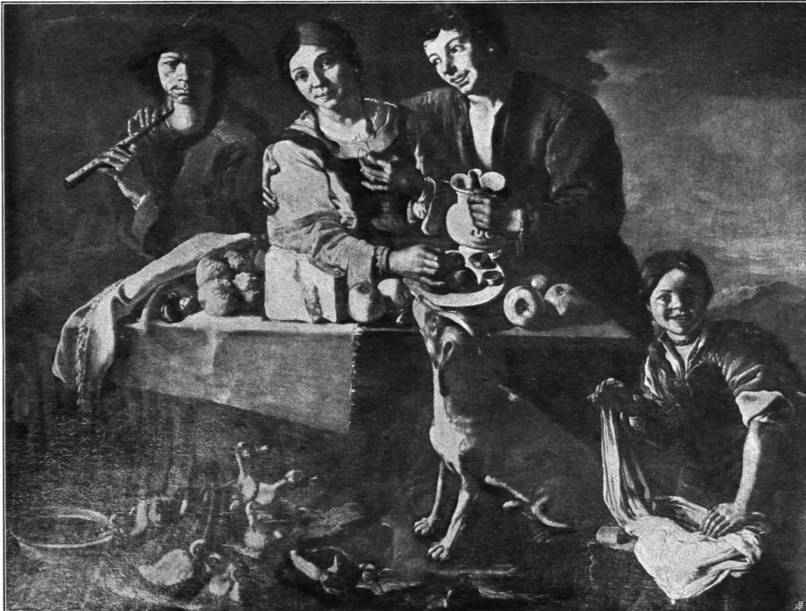
Fig. 389 Kimmelbach, Schloß, Genreszene (S. 371)

Eine Reihe von Empire- und älteren Möbeln, darunter eine schöne Stockuhr von Toni Jessner in Wien vom Anfange des XIX. Jhs., eine zweite, deren braunes Holzgehäuse mit Goldbronzefiguren sitzender Frauen bekrönt ist, von Laurentius Landensperger Eperies, Mitte des XVIII. Jhs. — Luster in Form einer flachen Schale mit Goldbronzeppliken. Anfang des XVIII. Jhs. (zum Teil ergänzt). — Ofenschirm, die Wände aus einer gepreßten Ledertapete mit großem Granatapfelmuster gebildet. Oberitalienisch, um 1600.