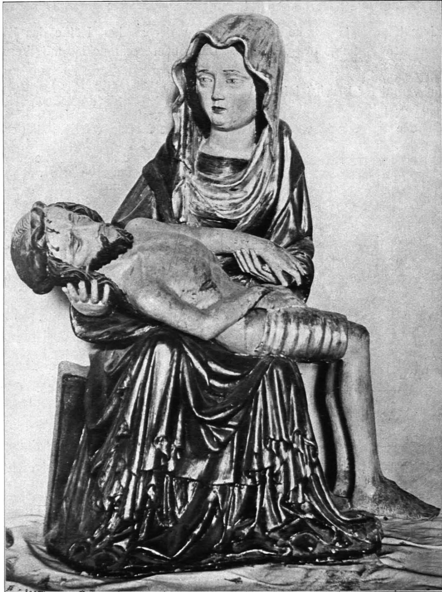
Fig. 392 Neumarkt, Pfarrkirche, Pietà (S. 375)

Um eine Stufe erhöht, durch einspringenden stumpfen Spitzbogen mit glattem Gewände vom Langhause getrennt; mit dem wieder um eine Stufe erhöhten, in fünf Seiten des Achteckes geschlossenen Altarraum von einem Kreuzgewölbejoche und einer vierseitigen und fünf dreieckigen Kappen überwölbt.