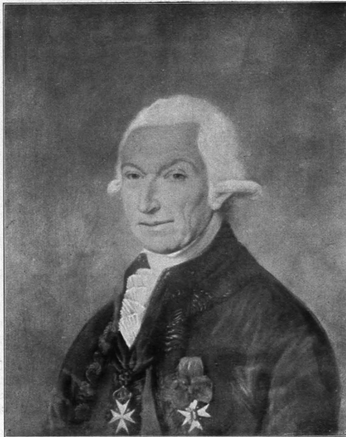
Fig. 175 Schloß Strannersdorf, Porträt des Marquis Louis François de Chambray (S. 141)