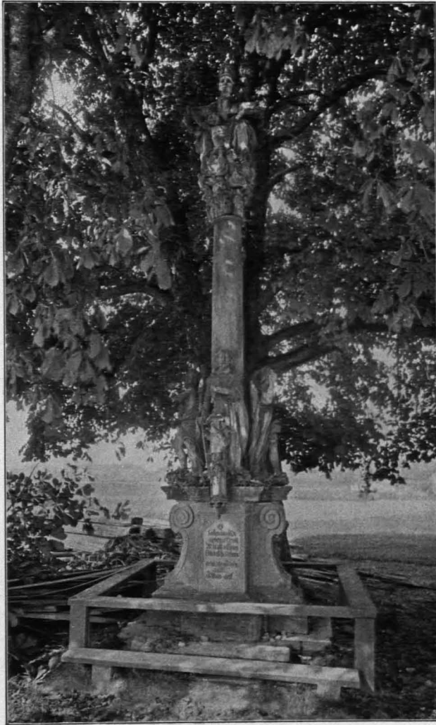
Fig. 173 Mank, Dreifaltigkeitssäule (S. 139)