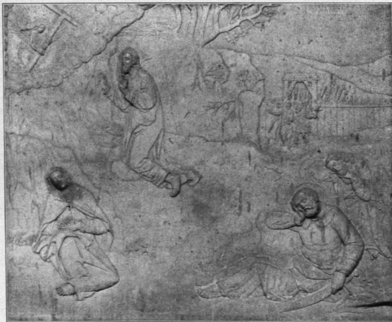
Fig. 152 Loosdorf, Christus am Ölberg (S. 122)