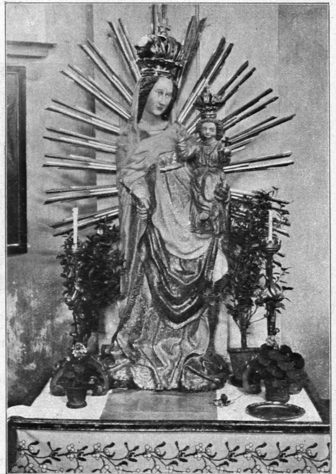
Fig. 146 Seitenaltar, 1906 abgerissen (S. 122) Loosdorf, Pfarrkirche Fig. 147 Madonnenstatue (S. 122)