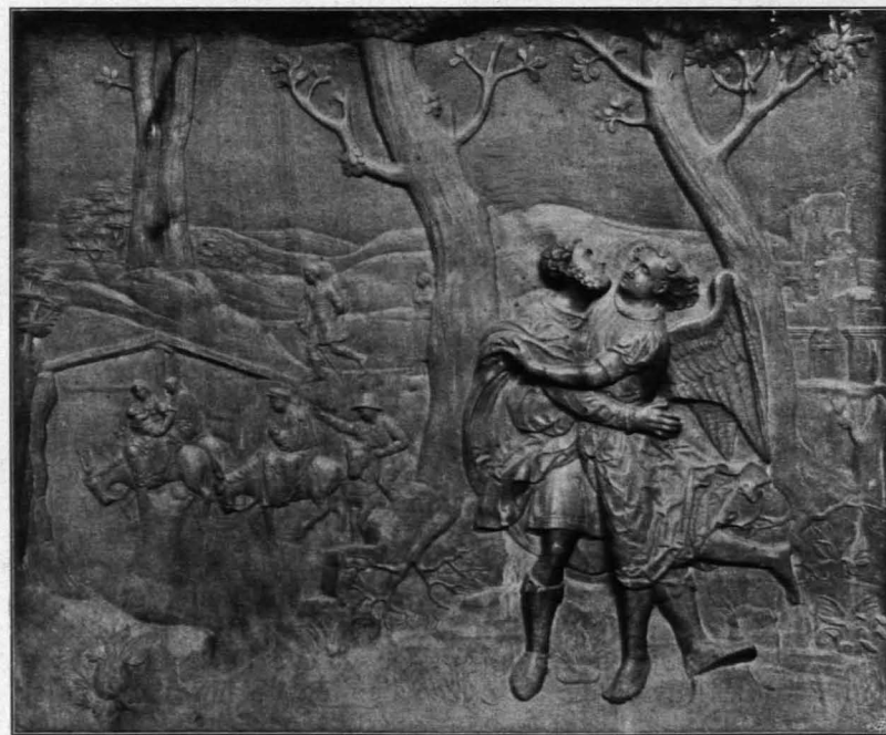
Fig. 150 Loosdorf, Ringkampf Jakobs (S. 122)

Turm. Turm: Untergeschoß; einfaches Gratgewölbe; im O. rechteckige Haupttür nach der Kirche, darüber Breitnische; im W. rechteckige Tür, darüber breites Oberlicht mit schmiedeeisernem Gitter.