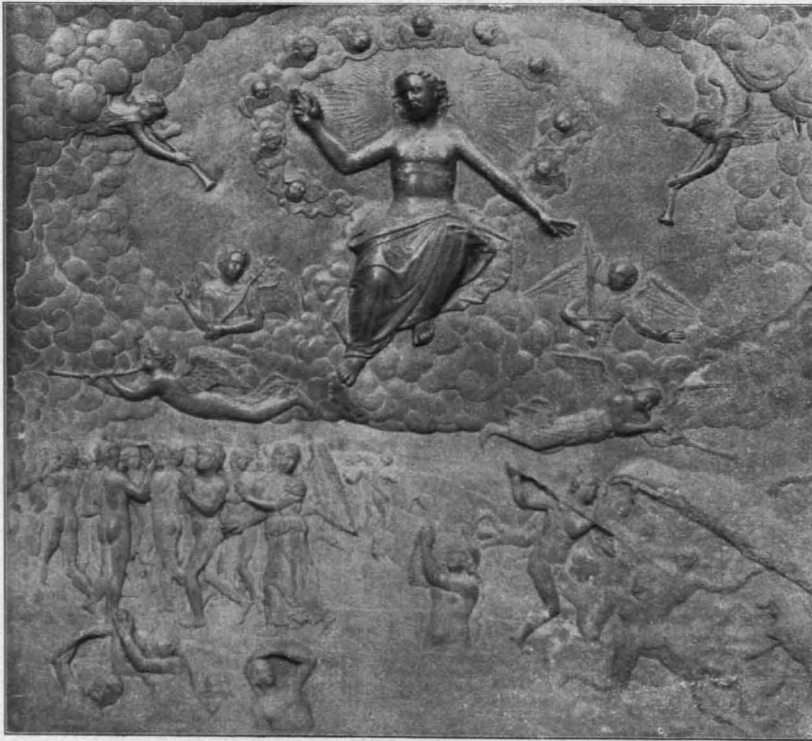
Fig. 148 Loosdorf, Jüngstes Gericht (S. 122)

Decke: Vier durch Gurtbogen eingefasste Travees, dazwischen flaches Kreuzgewölbe mit Stuckbändern auf den Graten; in den vier Zwickeln weiße Kartuschen und verschieden geformte Gitterornamente aus weißem Stucke XVIII. Jh.