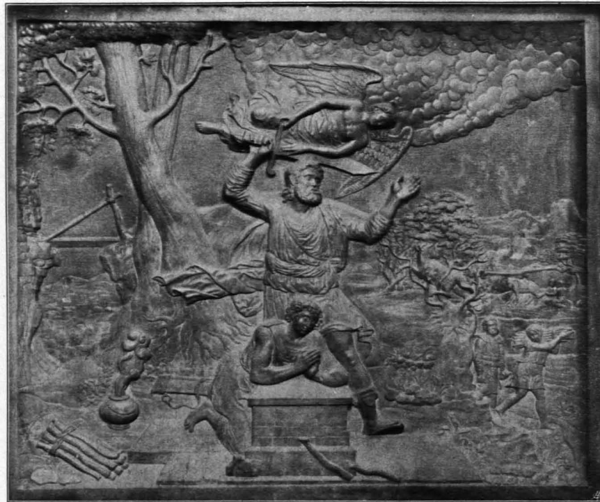
Fig. 149 Loosdorf, Opferung Isaaks (S. 122)

mit Halbkuppel über einfachem Gesimse. Im N. und S. je eine rechteckige Tür in dunkelgrauer Rahmung. In jedem Felde ein gerahmtes segmentbogiges Emporenfenster mit verzierter Sohlbank und ausgebauchter Gitterbrüstung aus Holz. XVIII. Jh. Über dem Gesimse in jedem Felde ein Fenster wie die des Langhauses. Im Altarraume, links und rechts vom Hochaltare, je ein rechteckiges Fenster in Segmentbogenlaibung.