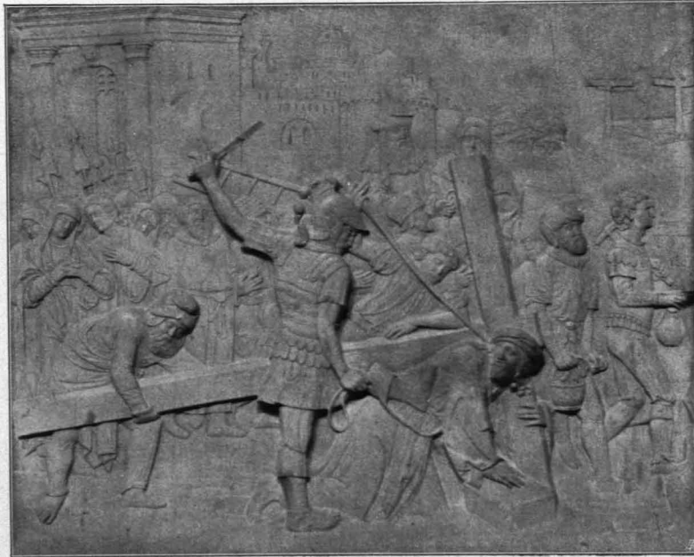
Fig. 151 Loosdorf, Kreuztragung (S. 122)

Anbau 2. Sakristei, nördlich vom Chore, genau wie Anbau 1; im N. und O. je ein Rundbogenfenster in tiefer Nische. Von der Stiege zum oberen Oratorium Zugang zur Kanzel.