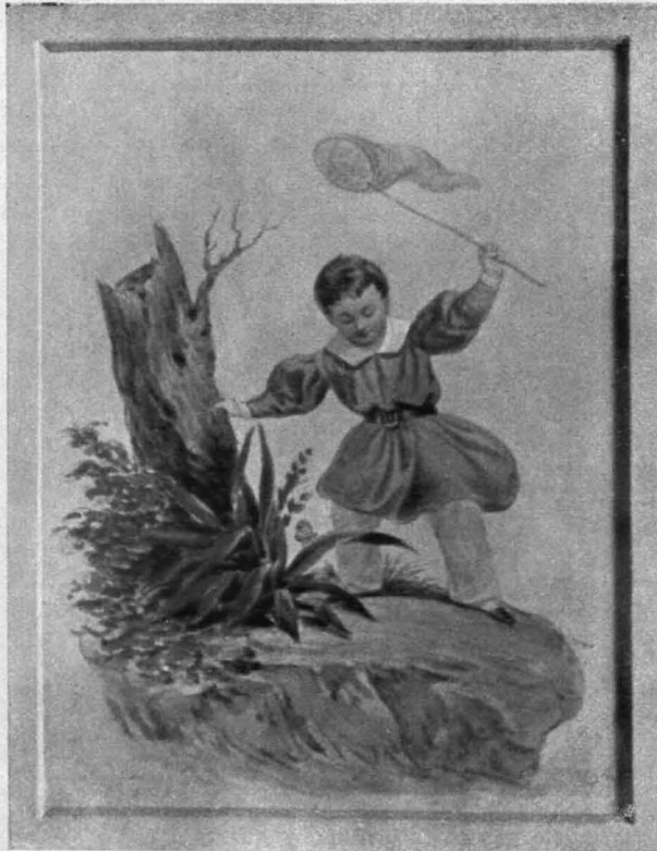
Fig. 157 Sitzenthal, Aquarellminiatur des Grafen Siegmund Braida (S. 128)

neu durchgebrochenen rechteckigen Fenstern und einem vermauerten Spitzbogenfenster. Der Ostabschluß in fünf Seiten des Achteckes mit zwei einmal abgestuften, oben abgeschrägten Strebepfeilern und vermauerten, aber noch kenntlichen Spitzbogenfenstern in den drei Schrägen. Im W. niedriger, schindelgedeckter Anbau. Hohes Ziegelsatteldach.