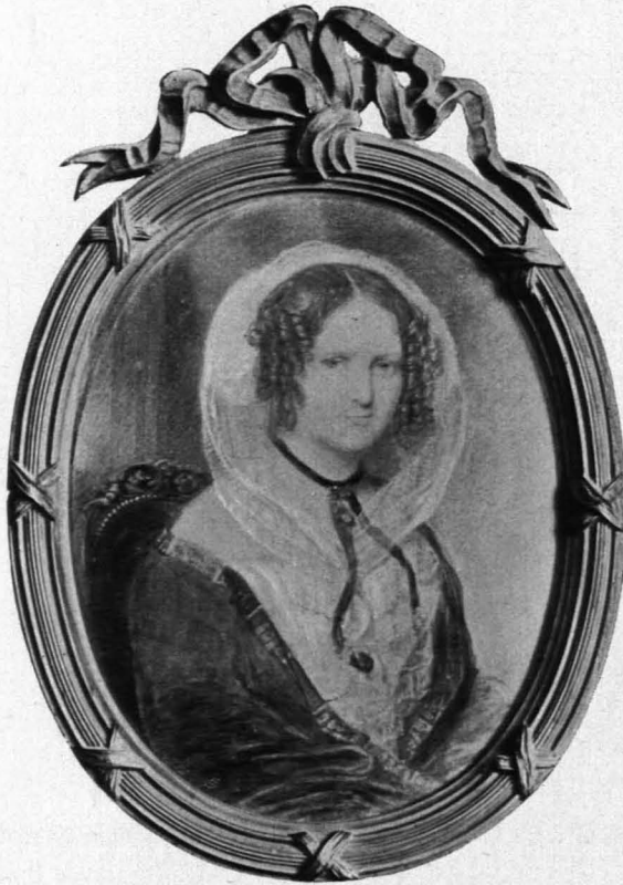
Fig. 158 Sitzenthal, E. Petter, Miniaturporträt der Gräfin Sophie Coudenhove (S. 129)