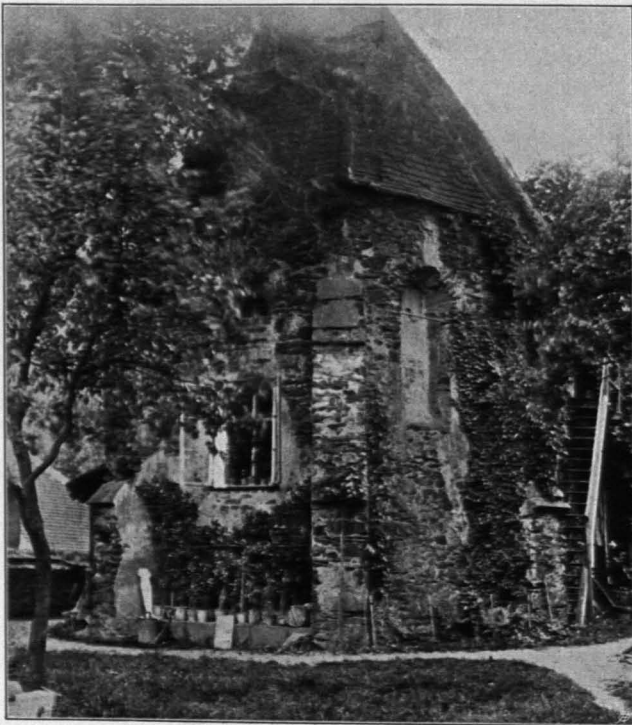
Fig. 155 Loosdorf, Ehemaliger Kärner (S. 125)

Grabsteine: 1. Im Untergeschosse des Turmes; gelbe Kalksteinplatte; etwa 115 × 218; mit Gestalt eines liegenden Ritters in hohem, fast frei herausgearbeitetem Relief; der Ritter in voller Rüstung, das Haupt auf einem Kissen, neben ihm liegen die Handschuhe. Zu Füßen des Ritters liegt ein Löwe; in den vier Ecken je ein nacktes Knäbchen mit abgebrochenen Emblemen. Über dem Kopfe eine Rückplatte, wo das Grabmal an die Wand anstand (Fig. 154). Die Inschrift, am Rande der Platte geführt, nennt die Verdienste des Bestatteten, des Ritters Hans Wilhelm von Losenstein, gestorben 1610 (vgl. KEIBLINGER a. a. O. und DUELLII excerpt. geneal. hist. lib. II 352).