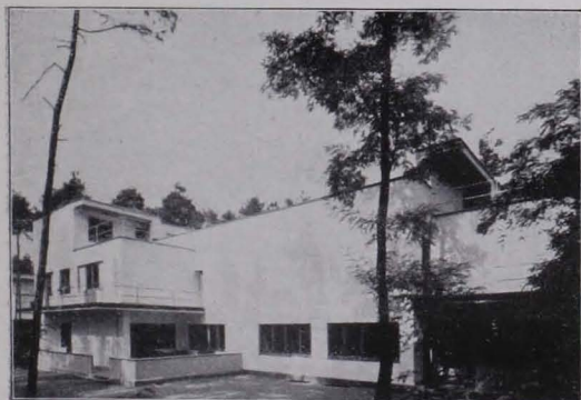
Abb. 109 und 110 MEISTERHÄUSER BAUHAUS DESSAU, 1926

ancierung dieser Arbeiten gibt diese verschiedenen Einflüsse wieder; trotzdem vereinigt sie alle die unbedingte Bemühung um eine einfache, übersichtliche und saubere Bauform. Man kommt allmählich darauf zurück, dem Wohnhaus seine ihm zukommende Stellung zuzuweisen, die im einzelnen eine bescheidene, für das Ganze aber wiederum eine ungeheuer bedeutungsvolle ist. Das Erkennen der Grenzen jeder Aufgabe ist allein schon ein großer Gewinn. Daneben aber liegt hierin die eigentliche Einsicht in das Ökonomische der Sache enthalten.