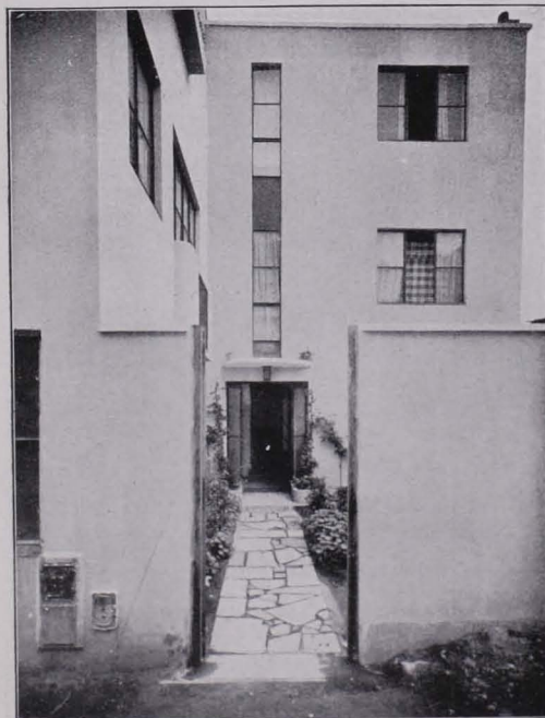
Abb. 98 HOTEL PARTICULIER DE MONSIEUR I. L. PARIS CITÉ SEURAT, ENTREE, 1924/25