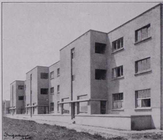
Abb. 99 LA CITÉ MODERNE, BRÜSSEL