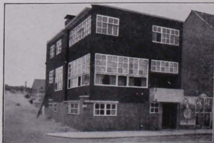
Abb. 100 BRÜSSEL, WOHNHAUS

bauten handelt, jedenfalls mit einer Entschlossenheit und von einem wahren Baugeist beseelt, der jetzt schon kunstgeschichtlich als ein Ereignis erster Ordnung gelten kann. Mit infolge dieses imposanten Geschehens ist eine internationale architektonische Bewegung in Fluß gekommen, die offensichtlich immer weiter um sich greift. Ihre Erscheinungen in Polen, Böhmen, Rußland oder Belgien und Frankreich sind zwar ähnlich im Wesen, wie es jeder frühere Baustil ebenfalls war, doch national je nach dem