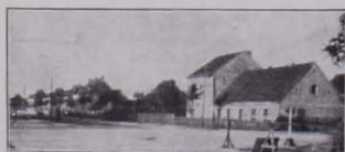
Abb. 57 VORN ALTMÄRKISCH, HINTEN „NEUMÄRKERISCH“