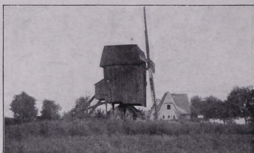
Abb. 58 WINDMÜHLENKAMPF DES HEIMATSCHUTZES „Siedlungshäuser“ von 1926 in der Mark.