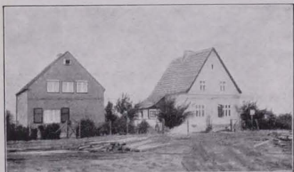
Abb. 56 LINKS HEIMATLICH, RECHTS „HEIMATSCHUTZ“!