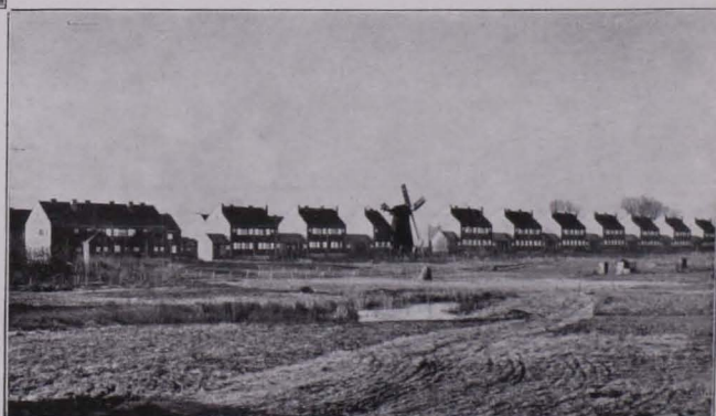
Abb. 59 SIEDLUNG HOHENSCHÖNHAUSEN BEI BERLIN 1926 — in Freundschaft mit der Windmühle