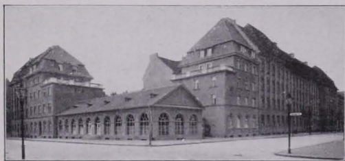
Abb. 32 Alfa-Werke mit Wohnungen am Schillerpark in Berlin N. angebaut an Schulen von L. Hoffmann. Verunstaltung durch „Anpassung“: verkrüppelte Mansardendächer; das durchgezo- gene Gurtgesims und die gleiche Quaderung sollen „Anpassung“ sein. Vorn keine Reitbahn von 1700, sondern eine — Industriehalle von 1925. Tötung des Hoffmannbaus durch Charakterlosig- keit.

schon aus praktischen Gründen; aber wenn er Elemente der benachbarten Bauten aus früherer oder späterer Vergangenheit mit übernehmen soll, seien es Dachformen, Gesimshöhen, Profile und womöglich auch den „Stil“, dann muß er notgedrungen seinen neuen Bau mit einer Maskerade überziehen, muß er Theater spielen. Und wir meinen, daß Baukunst doch etwas anderes ist als Schauspielerei. Eines der vielen schlagenden Beispiele ist die Handelskammer in Braunschweig, die das wunderschöne Gewandhaus total kaputt gemacht hat, entworfen von einem Hochschulprofessor und seinerzeitigen Mitgliede des Braunschweiger Verunstaltungsausschusses, ein anderes der schon erwähnte Wertheimbanbau, der ein Hohn auf Messel ist, gebaut neunzehnhundertundsechszwanzig, und noch ein anderes die Ecke neben Hoffmanns Schule am Schillerpark, eine der greulichsten Anpassungsverschönerungen. In alten Zeiten baute immer die Gegenwart ihre eigenen Dinge an das Alte, zwar nicht immer rücksichtslos, aber meist hart, machte keinen Kniefall, keine Rückenkrümmung aus dem, was sie für richtig hielt. Ludwig Hoffmann selbst noch ließ ruhig hohe Brandgiebel vorhandener Mietkasernen sichtbar und baute Feuerwachen niedrig an, ohne den geringsten Versuch der „Anpassung“. Quod licet jovi, non licet — — —