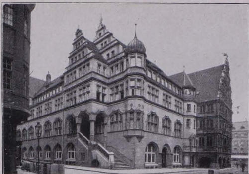
Abb. 30 Verschönerung des schönen Gewandhauses in Braunschweig durch die „angepasste“ Han- delskammer. Profile des alten Baus herumge- zogen. Stil „sol“ derselbe sein. 1912.