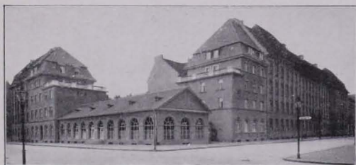
Abb. 32 Alfa-Werke mit Wohnungen am Schillerpark in Berlin N. angebaut an Schulen von L. Hoffmann. Verunstaltung durch „Anpassung“: verkrüppelte Mansardendächer; das durchgezo- gene Gurtgesims und die gleiche Quaderung sollen „Anpassung“ sein. Vorn keine Reitbahn von 1700, sondern eine — Industriehalle von 1925. Tötung des Hoffmannbaus durch Charakterlosig- keit.

schon aus praktischen Gründen; aber wenn er Elemente der benachbarten Bauten aus früherer oder späterer Vergangenheit mit übernehmen soll, seien es Dachformen, Gesimshöhen, Profile und womöglich auch den „Stil“, dann muß er notgedrungen seinen neuen Bau mit einer Maskerade überziehen, muß er Theater spielen. Und wir meinen, daß Baukunst doch etwas anderes ist als Schauspielerei. Eines der vielen schlagenden Beispiele ist die Handelskammer in Braunschweig, die das wunderschöne Gewandhaus total kaputt gemacht hat, entworfen von einem Hochschulprofessor und seinerzeitigen Mitgliede des Braunschweiger Verunstaltungsausschusses, ein anderes der schon erwähnte Wertheimianbau, der ein Hohn auf Messel ist, gebaut neunzehnhundertundsechszwanzig, und noch ein anderes die Ecke neben Hoffmanns Schule am Schillerpark, eine der greulichsten Anpassungsverschönerungen. In alten Zeiten baute immer die Gegenwart ihre eigenen Dinge an das Alte, zwar nicht immer rücksichtslos, aber meist hart, machte keinen Kniefall, keine Rückenkrümmung aus dem, was sie für richtig hielt. Ludwig Hoffmann selbst noch ließ ruhig hohe Brandgiebel vorhandener Mietkasernen sichtbar und baute Feuerwachen niedrig an, ohne den geringsten Versuch der „Anpassung“. Quod licet jovi, non licet — — —