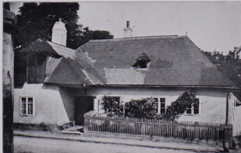
Fig. 568 Nußdorf, Hammerschmiedgasse Nr. 23 (S. 450)