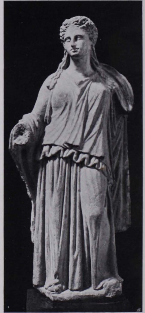
Fig. 543 Kopf einer unbekanntes Römerin Sammlung Matsch (S. 424) Fig. 544 Statuette einer Göttin

Erwähnt sei auch noch ein ziemlich wohlerhaltener antiker Helm aus Metall.