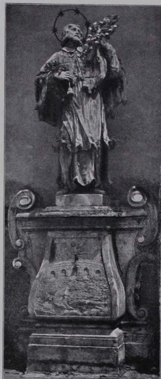
Fig. 515 Heiligenstadt, Johannes-Nepomuk-Statue vor der Michaelskirche. (S. 410)