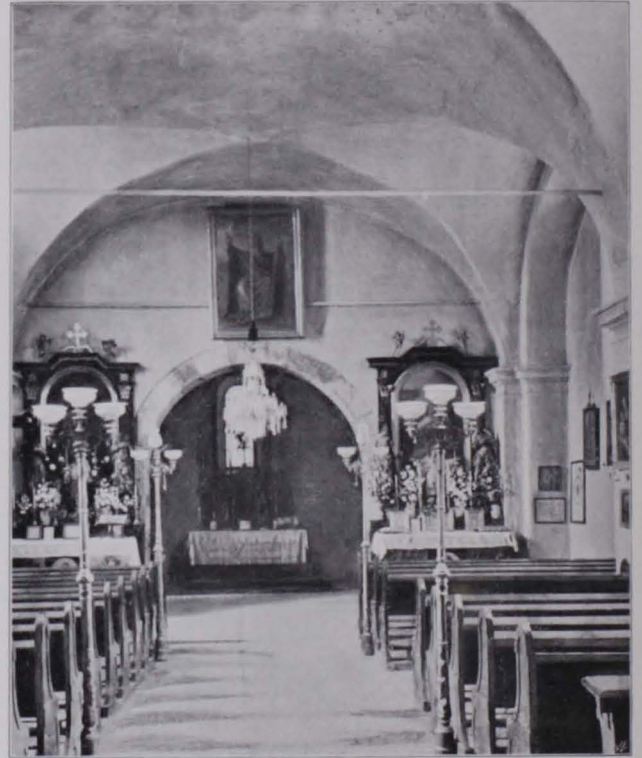
Fig. 510 Heiligenstadt, Jakobskirche, Inneres (S. 407)