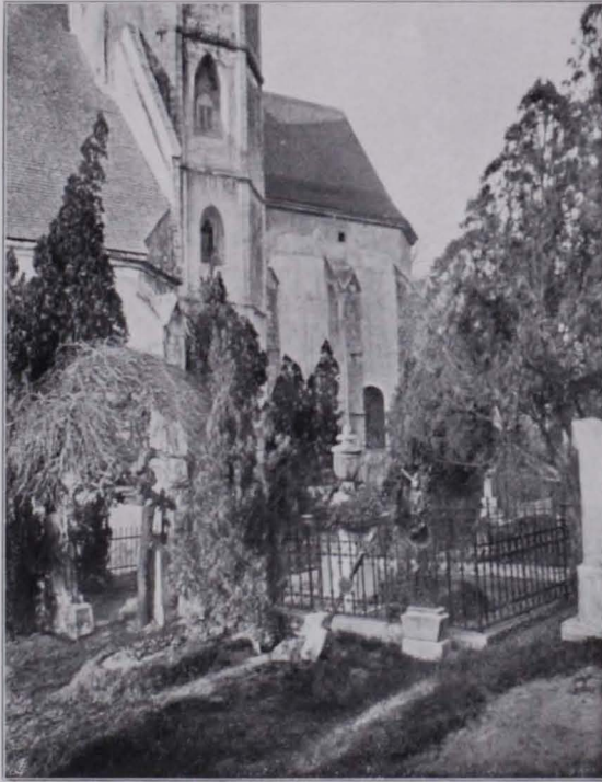
Fig. 508 Heiligenstadt, Michaelskirche und Friedhof vor dem Umbau (S. 406)