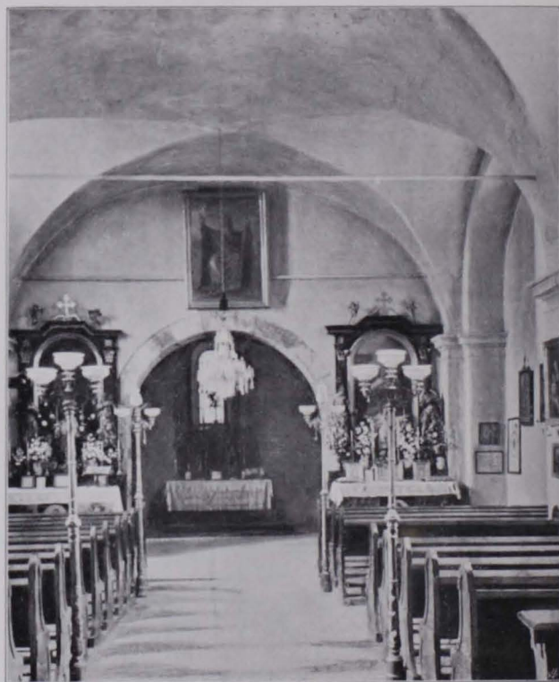
Fig. 510 Heiligenstadt, Jakobskirche, Inneres (S. 407)

Auch in der Jakobskirche wurde 1752 eine Reparatur durchgeführt, vom 22. Mai dieses Jahres datiert ein Kontrakt mit Franz Doppelreitter, bürgerlichem Zimmermeister in Liechtental, wegen Erbauung eines Turmes in der Jakobskirche (Kontrakt und Überschlag im Stiftsarchiv Klosterneuburg). Eine Restaurierung der St. Michaelskirche erfolgte 1838, eine sehr umfassende aber 1894—1897, wobei die Kirche bis auf die Grundmauern abgetragen wurde, so daß sie in ihrer gegenwärtigen Gestalt nur noch den Grundriß