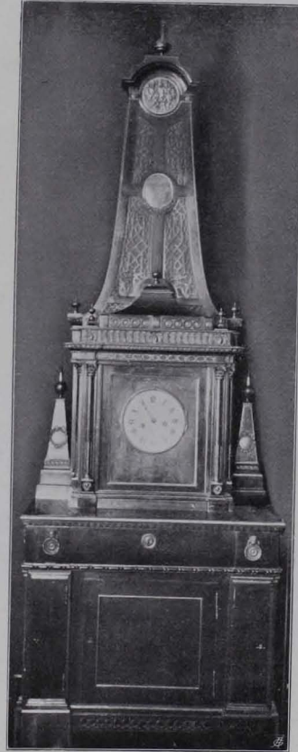
Fig. 453 Alt-Wiener Uhr (S. 365) Sammlung Reinhardt Fig. 454 Spieluhr (S. 365)