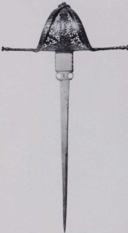
Fig. 436 Eisengeschmittener Linkshanddolch (S. 352)