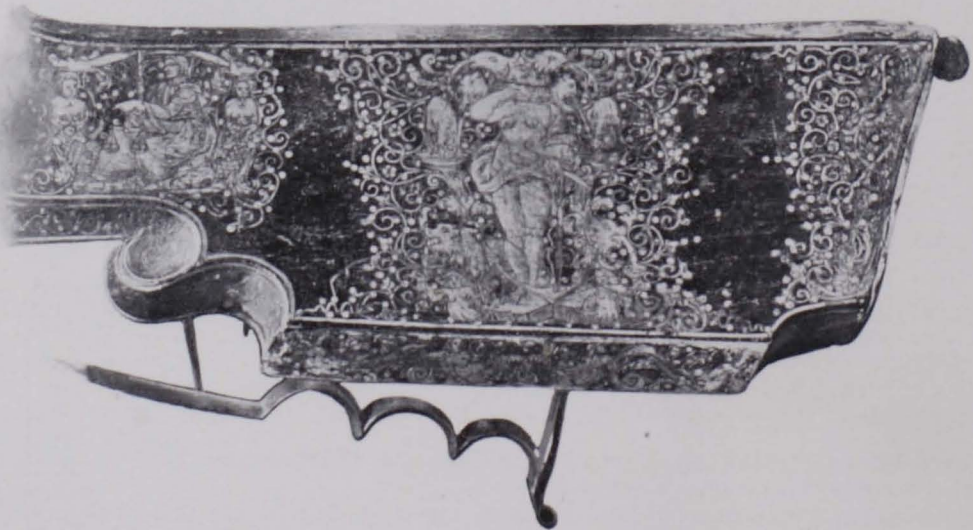
Fig. 434 Sammlung v. Werner, Eingelegter Gewehrkolben (S. 351)

2. Zischägge mit Ohrenklappen und Nasenschutz, der Nasenschutz fünfmal geschoben. XVII. Jh.