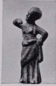
Fig. 313 Genre- figürchen (S. 269) Sammlung Fischer