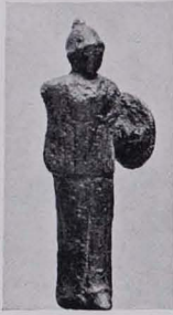
Fig. 312 Athene (S. 269)