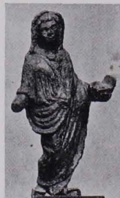
Fig. 316 Opfern- der Römer (S. 270)