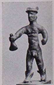
Fig. 318 Hermes, Leobersdorf (S. 270)