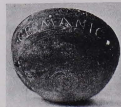
Fig. 317 Bronzeschälchen (S. 270)