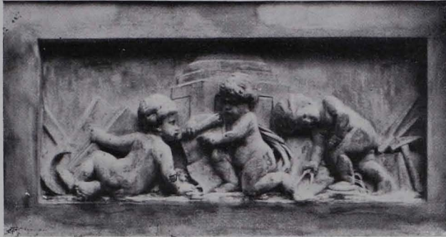
Fig. 296 Neuwaldegg, Relief am Hause Artariastraße 12 (S. 263)

hohem, erneutem Postamente Figur aus Sandstein, nackter bärtiger Mann eine Muschel haltend, das Element des Wassers darstellend; erste Hälfte des XVIII. Jhs. Ferner, der Tradition nach von gleicher Provenienz, eine dekorative Vase mit Mascherons und Widderköpfen verziert; um 1780.