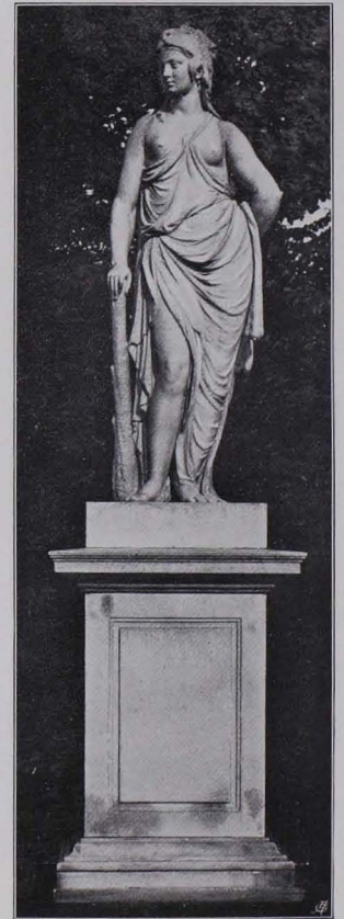
Fig. 211 Schönbrunn, Omphale (S. 185)

tierter Helm, hohe Sandalen. Mit der Linken hält er die sterbende Lucretia, die Rechte hebt den herausgezogenen Dolch. Lucretia, in langem Gewande mit herabhängenden Armen, sinkt mit dem Ausdrucke einer Sterbenden zurück. Von Platzer.