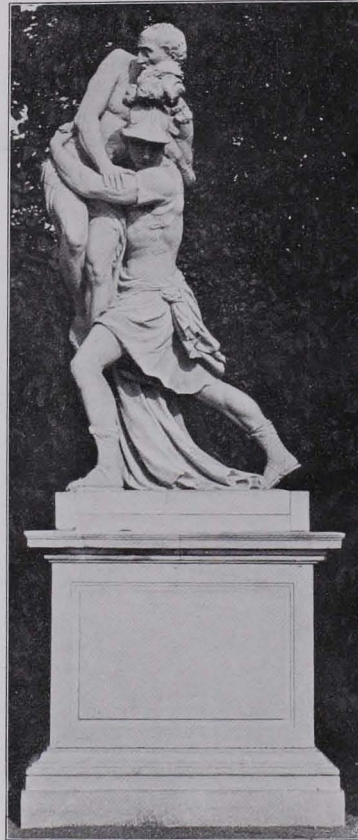
Fig. 210 Schönbrunn, Aeneas und Anchises (S. 185)