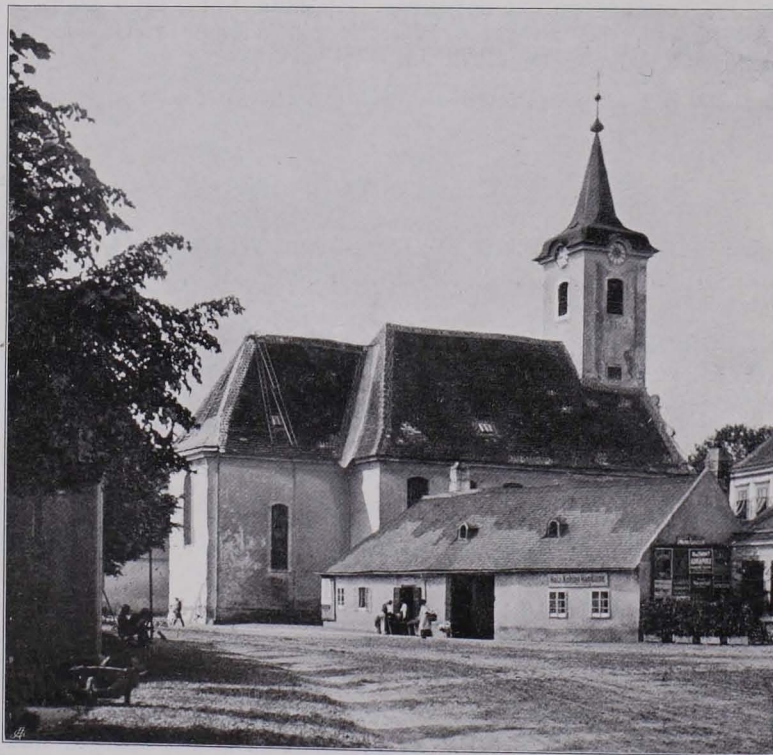
Fig. 102 Lainz, Pfarrkirche (S. 86)

Langhaus. Langhaus: W. Giebelfront mit ein wenig vorspringendem Mittelrisalit, in das sich der Turm fortsetzt. Links und rechts zwischen Lisenen ein großes eingeblenndetes Feld; im Risalit Segmentbogentür in