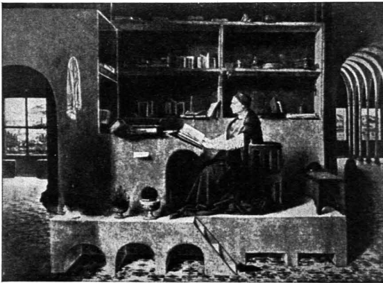
Abb. 17. Antonello da Messina, S. Hieronymus im Studierzimmer, 1479

Diese räumliche Strenge einer vergangenen europäischen Epoche verbindet sich mit einer noch lebendigen Wohnkultur