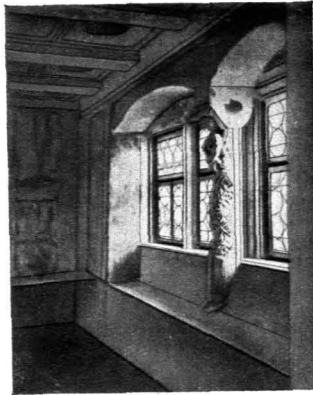
Abb. 6. Zimmer in Rothenburg o. d. T.

Die zierlichen altenglischen Adammöbel begreift man aus der Aufstellung, wie sie Abb. 5 aufweist. Die völlige Bildlosigkeit der Wand und die helle klare Tönung der Wand und Decke unter Zurücktreten des Schmuckwerks stellt an das einzelne in diesem Milieu aufgestellte Möbel die höchsten Ansprüche, welche jene Zeit mit großer Finesse zu erfüllen wußte.