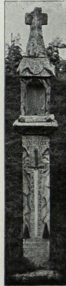
Fig. 452 Straß, Bildstock (S. 542)

8. Fußweg nach Kammern; toskanische Säule auf quadratischem, weiß gefärbtem Ziegelpostament; über vorkragender Gesimsplatte vierseitiges Tabernakel mit rechteckiger Flachnische vorn. Profiliertes Gesimse, Ziegeldach, darauf Steinkruzifixus mit massivem Kalksteinkreuz mit Dreipaßendungen. Ende des XVII. Jhs.