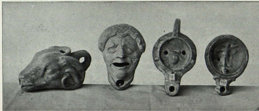
Fig. 442 Göttweig, Antikenkabinett, Lampen (S. 531)

1. Eindochtige Lampe in Form eines mit Sandalen bekleideten menschlichen Fußes, lichter Ton, gelb überzogen, stark abgeblättert, Verschnürung sehr gut sichtbar, Dochtloch durchgebrochen beim Nagel der