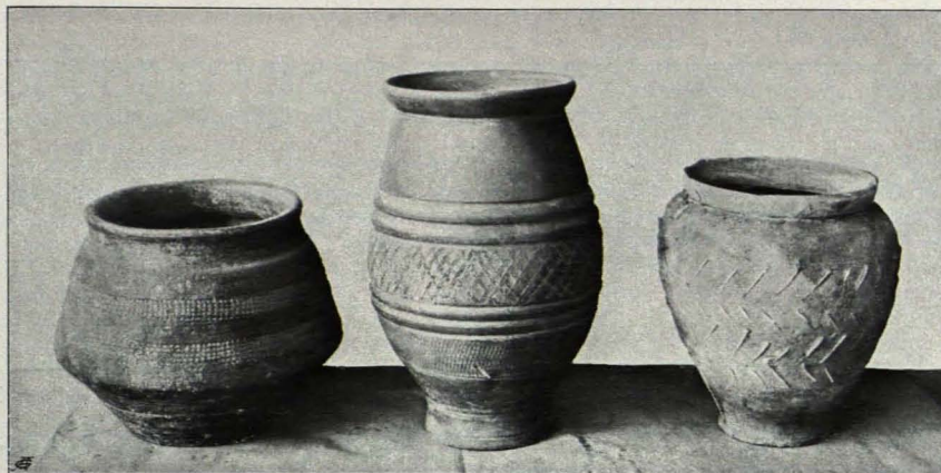
Fig. 439 Göttweig, Antikenkabinett, Tongefäße (S. 529)

2. Einhenkeliger Krug, grauer, gut geschlemmter Ton, 0,20 m hoch, 0,15 m gr. Weite, 0,04 m Mündungsdurchmesser, kugelförmiger Bauch, breiter, niedriger Standring, hervortretende Drehgurten am Unterteil des Bauches, deutlicher Absatz zum etwas konischen Hals, trichterförmige, profilierte Mündung, Lippe etwas nach abwärts gebogen, Henkel bandartig, lang, scharf geknickt. (Typus des ausgehenden I. Jhs. n. Chr.; derselbe Oberteil in Waldmössingen [Der obergermanisch-rätische Limes Lief. VI, Taf. IV Nr. IV/12]; ein ähnliches Exemplar gefunden in Butzbach [O. R. L. Lief. I, Taf. II/12].)