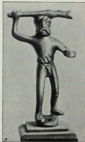
Fig. 429 Herkules (S. 523)