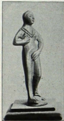
Fig. 428 Venus (S. 523)

Fig. 432. Fig. 432. 1. Armspange, beide Enden bilden Schlangenköpfe. 2. Geschlossener Armring.