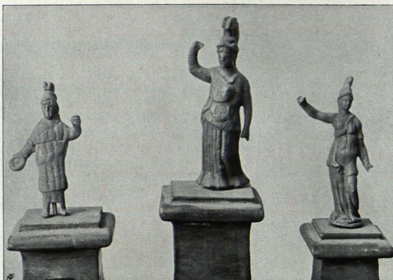
Fig. 422 Göttweig, Antikenkabinett, Hermesfigürchen (S. 521)

Fig. 426. Fig. 426. 1. Römische Priesterin, 0·075 m hoch, langes Untergewand, Mantel über den Kopf als Schleier gezogen, Gewand in der Mitte gegürtet, rechte Hand weggebrochen, in der linken runder Gegenstand (Schale?), stark abgerieben. Inv.-Nr. 96. Rohe italische Arbeit.