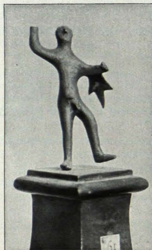
Fig. 423 Göttweig, Antikenkabinett, Herakles (S. 521)

2. Römischer Priester, 0·09 m hoch, lange Tunica, Toga über das Haupt gezogen, Gewandanordnung nach der Bronze etwas unklar; - beide Hände abgebrochen, hielt in der linken wahrscheinlich die patera, in der rechten ein Füllhorn, Füße ebenfalls weggebrochen. Inv.-Nr. 102. Rohe italische Arbeit (vgl. ganz ähnliches Exemplar in der Pariser Nationalbibl. BABELON-BLANCHET, Catalogue des bronzes antiques de la Bibliothèque Nationale n. 873).