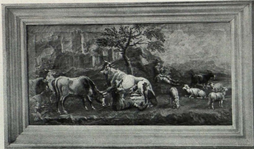
Fig. 406 Göttweig, Gemäldesammlung, Nr. 35 (S. 509)

67. (C.) Öl auf Holz, Tod des hl. Josef und Pendant dazu Maria mit Christkind am Sterbebette der hl. Anna stehend; datiert 1778. Eigenhändige Arbeiten des Kremser Schmidt (Fig. 408). 18 H. × 23 B. Fig. 408.