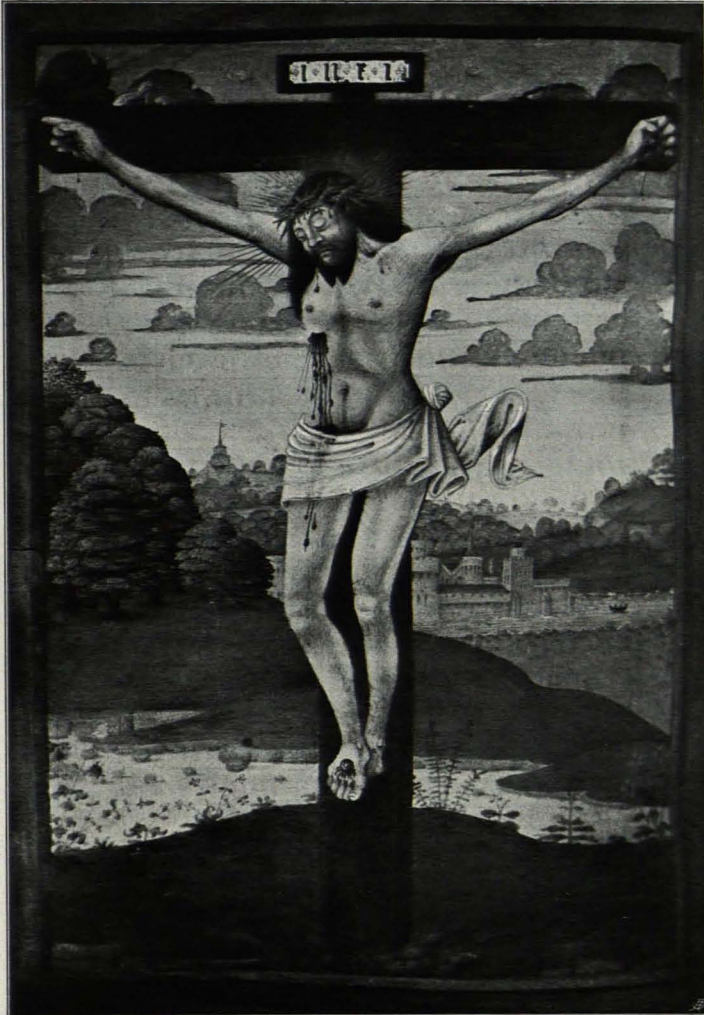
Fig. 393 Göttweig, Bibliothek, Nr. 12, f. 241 (S. 503)

Auf der Innenseite des rückwärtigen Einbanddeckels ist eine Zeichnung eingeklebt: Marter des hl. Erasmus, der unter der Spindel liegt, mit der ihm von zwei Jünglingen das Gedärme herausgewickelt wird; oben Halbfigur Satans, daneben in einem Kreise ein Engel, der die Seele des Heiligen im Schoße hält.