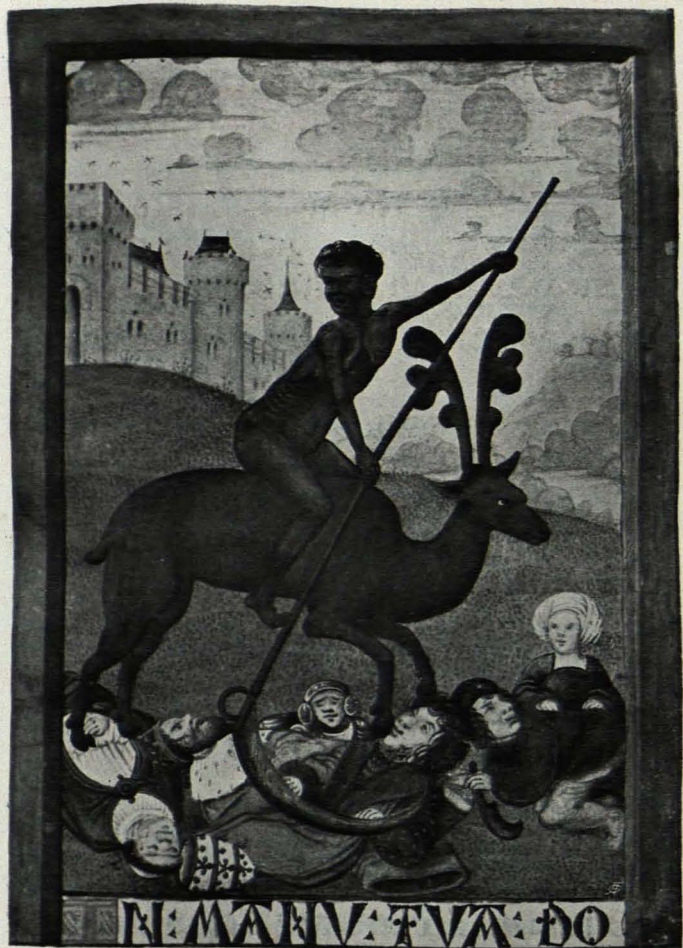
Fig. 392 Göttweig, Bibliothek, Nr. 12, f. 121 (S. 503)