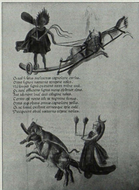
Fig. 389 Göttweig, Bibliothek, Nr. 7, f. 30 (S. 500)

Italienisch, XIV. Jh., mit Benutzung antiker Vorbilder. Die Handschrift ist verschiedenen Codices verwandt, in denen die Phenomena des Aratus in der Übersetzung des Cicero, zusammen mit dem Kommentar des Hyginus überliefert sind, ohne aber mit einem vollständig übereinzustimmen. Eigentümlich ist besonders, daß die Handschrift die Bilderreihe zweimal aufweist, und zwar in einer Form, aus der sich schließen läßt, daß das unmittelbare Vorbild eine der zahlreichen karolingischen Aratushandschriften gewesen ist. Die Handschrift enthält zunächst die verschiedenen Einleitungen: