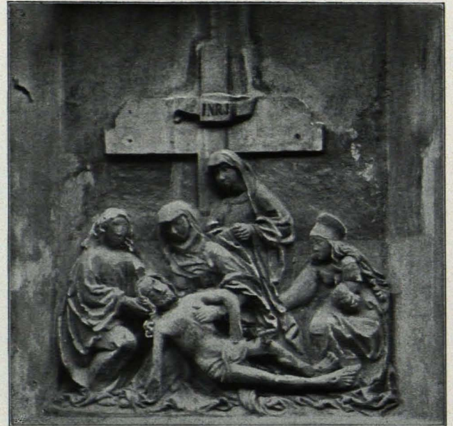
Fig. 287 Spitz, Relief am Hause Nr. 86 (S. 398)