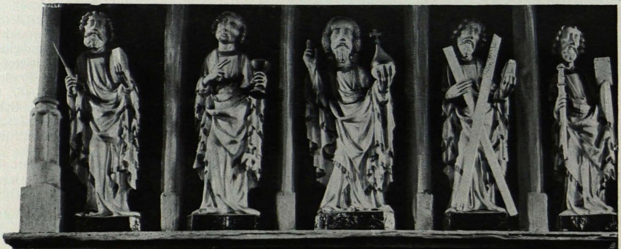
Fig. 277 Spitz, Pfarrkirche, Figuren von der Emporenbrüstung (S. 389)

Spitz, Pfarrkirche, Lichthäuschen (S. 389)