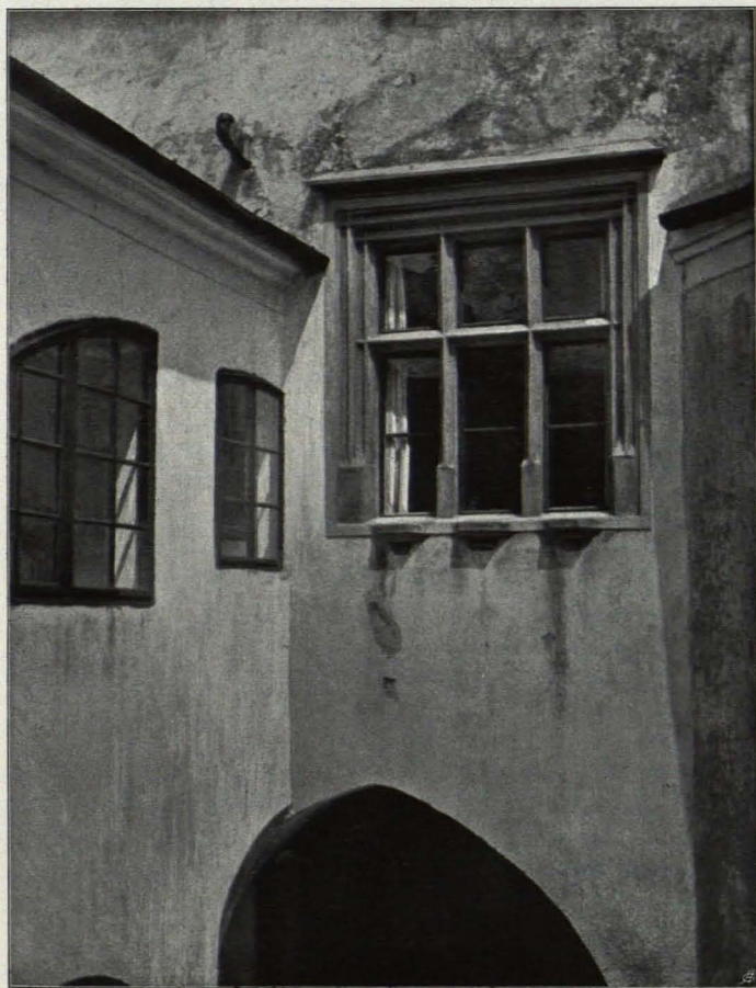
Fig. 235 Rastenberg, Schloß, Hoffenster (S. 347)

wahrnehmbar sind. Die jetzige Form der Einwölbung des Langhauses ist eine spätgotische und stammt aus der Zeit um 1500, während der Chor der Zeit um 1400 angehört. Im Chore befanden sich einst gemalte Fenster, deren letzte Überreste der Tradition nach zu profanen Zwecken verwendet worden sein sollen (s. Lit.).