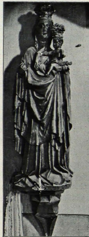
Fig. 177 Maria-Laach, Pfarrkirche, Madonnenfigur (S. 281)

auf. Hinten ein Zaun, dessen Tor geöffnet ist, bei dem ein fünfter Wächter schläft. Von ferne nahen die Marien, während ganz hinten die Begegnung Mariä Magdalenä mit Christus als Gärtner dargestellt ist. Tiefe bergige Hintergrundlandschaft. Goldgrund (Fig. 175).