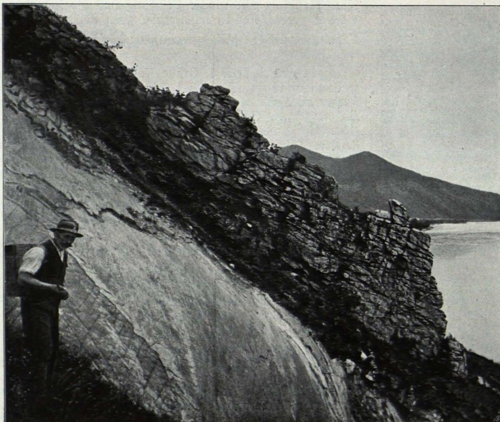
Fig. 261 Schwallenbach, Teufelsmauer (S. 376)

Naturdenkmal: Teufelsmauer; eine quer über den Bergabhang ziehende, bis zur Donaustraße reichende schmale Felswand, an deren auffallende Gestalt sich verschiedene Sagen knüpfen; vgl. Blätter für Landeskunde 1875 (Fig. 261).