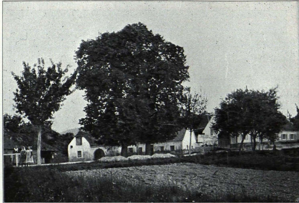
Fig. 229 Paudorf, Kaiserlinden (S. 339)

Bildstock: Weg nach Paudorf; Backstein, weiß und blau gefärbelt; auf quadratischer Basis vierseitiger Unterbau mit vier kleinen Säulchen in den Ecken, dazwischen rundbogige Flachnische; darüber achtkantiger Pfeiler, Platte, Tabernakel mit vier Rundbogenflachnischen; Zahnschnittgesimse, Ziegelzeldach mit eisernem Kreuz; Ende des XVIII. Jhs.