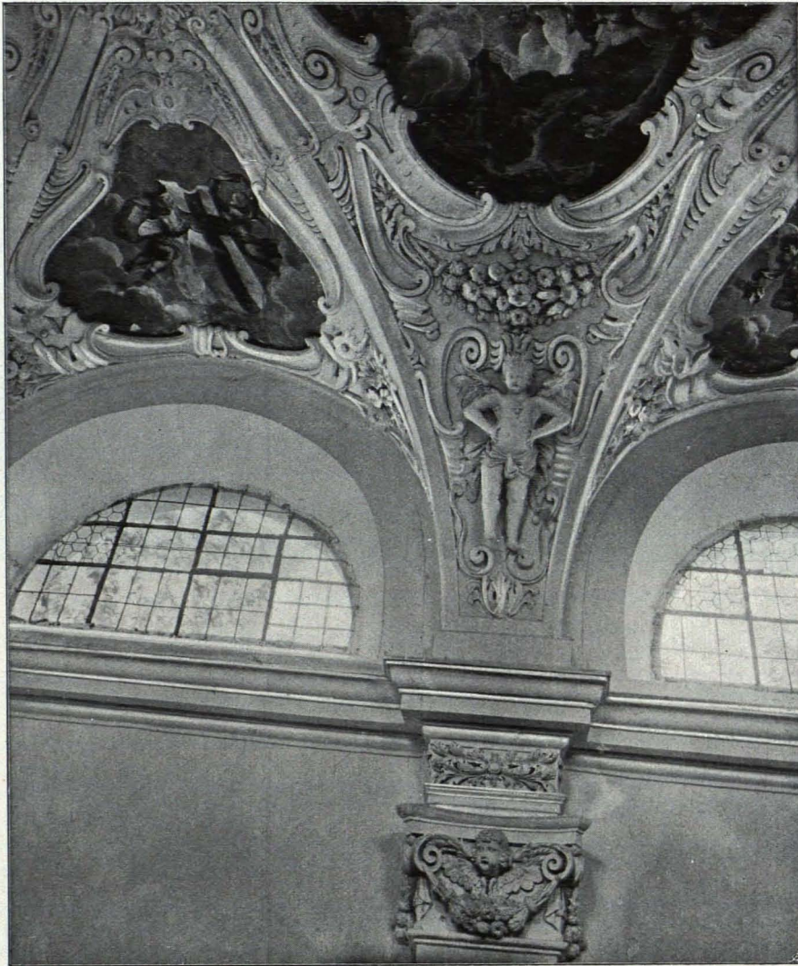
Fig. 228 Paudorf, Hellerhof, Detail von der Kapellendecke (S. 338)

Nordportal; über gedrücktem Rundbogen stark vorkragendes Gesimse mit Bekrönung durch eine Art liegender Volute, in der Mitte auf hohem Sockel männliche Büste mit antiker Drapierung; Anfang des